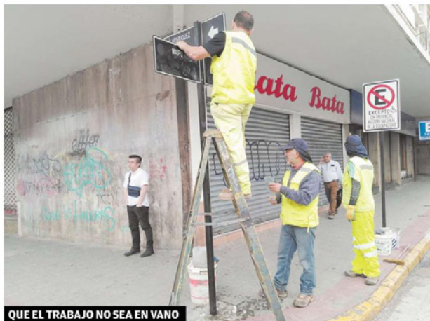
QUE EL TRABAJO NO SEA EN VANO

La horrible tendencia a pintar/ajear cuanto espacio público quede sin resguardo, no ha respetado ni a las muy útiles señales de tránsito, algunas de las cuales han quedado derechamente inservibles. Con esfuerzo se les está limpiando y ojalá que esta labor no sea vea empañada por los antisociales del aerosol, que atacan por todos lados.