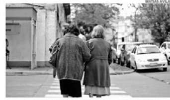
ADULTOS MAYORES ENFERMOS EN ÑUBLE SUPERAN LA MEDIA NACIONAL.