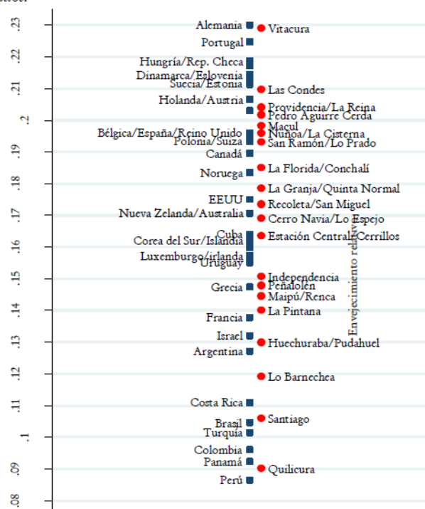
Figura 16. Envejecimiento relativo por comunas de la provincia de Santiago y países seleccionados.